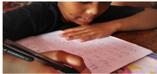
Gambar 2. Pematapan Pengenalan dan Penulisan Alfabet